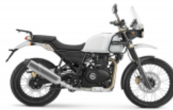
Himalayan 500 + $117.62