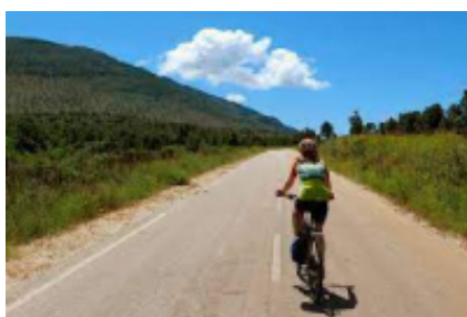
3 - Pogradec - Korçë - 51