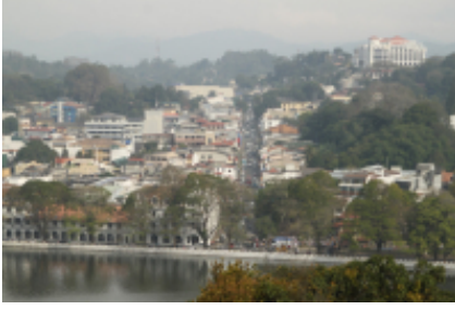
1 - - Colombo - 10