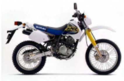
350 DR-SE + $0.00