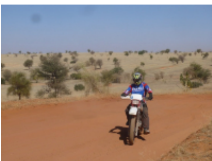
6 - Banfora - Sindou -