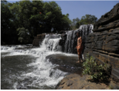
7 - Sindou - Banfora -