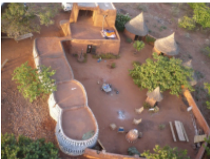
5 - Gaoua - Banfora -