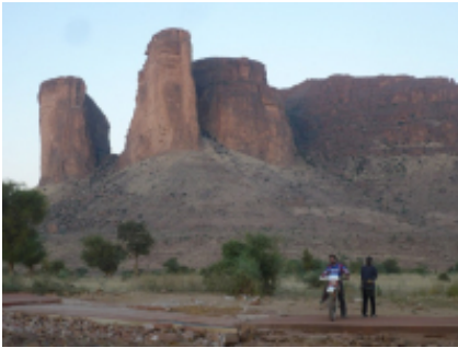
8 - Banfora - Bobo-Dioulasso -