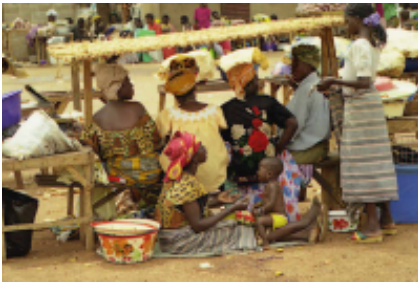
3 - Boromo - Gaoua -