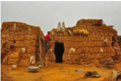
4 - Gaoua - Lobi -