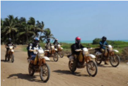
2 - Ouagadougou - Boromo -