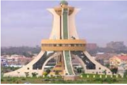
1 - - Ouagadougou -