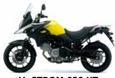
V- STROM 650 XT + $0.00