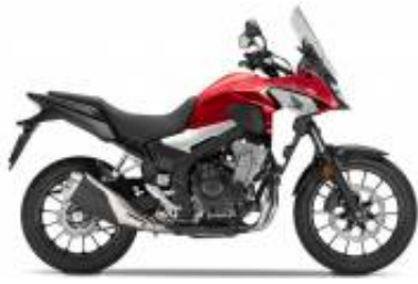
CB 500 X + $0.00