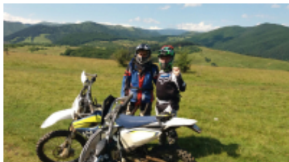
2 - Sibiu - Măgura - 6h