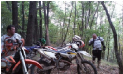
1 - - Sibiu -