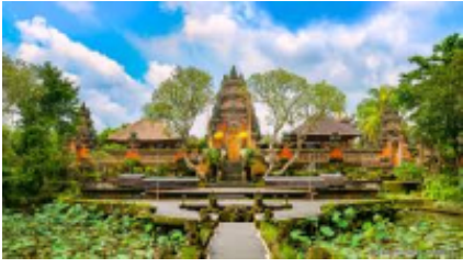
7 - Kintamani - -