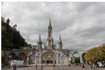
3 - Andorra-a-Velha - Tarbes -