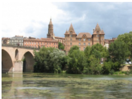
5 - Biarritz - Montauban -