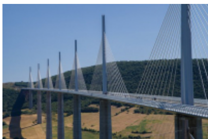
6 - Montauban - Millau -