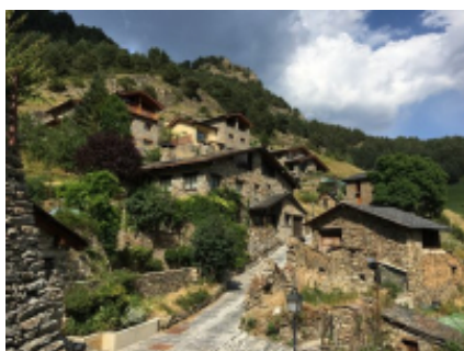
2 - Montpellier - Andorra-a-Velha -