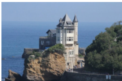
4 - Tarbes - Biarritz -