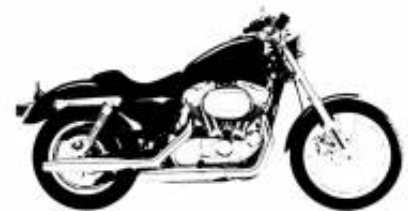
R 18 Transcontinental + $902.70