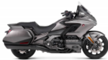
Goldwing DCT 2018 + $902.70