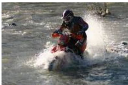
5 - Karapınar - Güzelyurt -