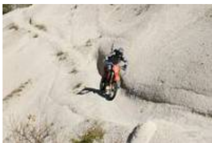
1 - - Antália -