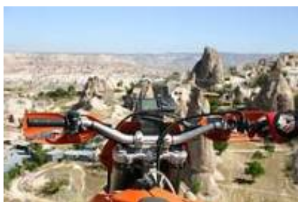
3 - Akseki - Taşkent -