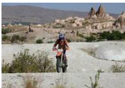
2 - Antália - Akseki -