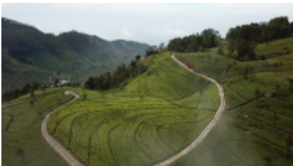
11 - Tissamaharama - Mirissa - 120