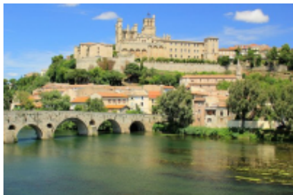
1 - Marseille - Montpellier -