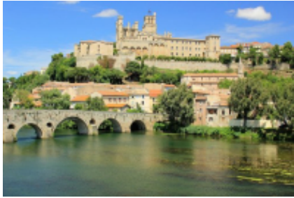
1 - Marseille - Montpellier -