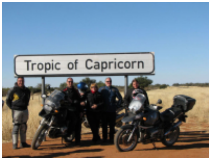
12 - Swakopmund - Swakopmund - 0