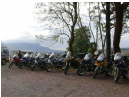
11 - Sossusvlei - Swakopmund - 240 miles