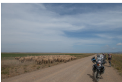
5 - Calvinia - Upington - 300 miles