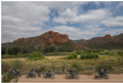
2 - Città del Capo - Cape Point - 90 miles