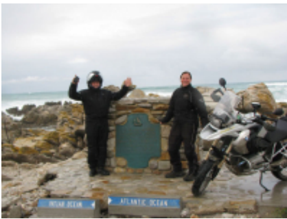
9 - Springboks Stellenbosch - Lambert's Bay - 260 miles