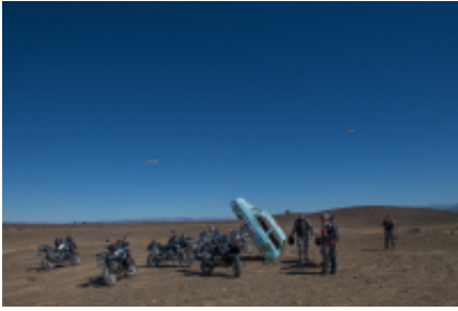
7 - Fish River Canyon - Springboks Stellenbosch - 190 miles