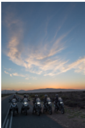
4 - Città del Capo - Calvinia - 230 miles