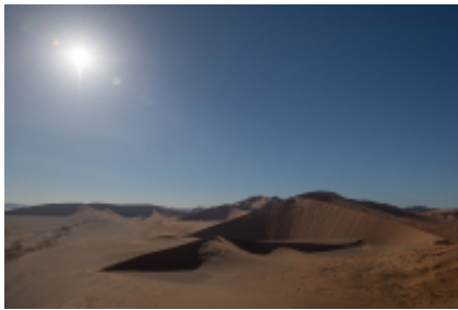
3 - Città del Capo - Tulbagh - 130 miles