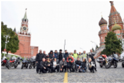
3 - Mosca - Valdaj - 400 km