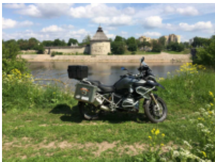
4 - Valdaj - San Pietroburgo - 400 km