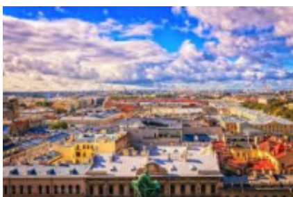
6 - San Pietroburgo - San Pietroburgo -