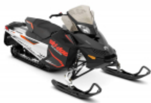
Bombardier 600 + $0.00