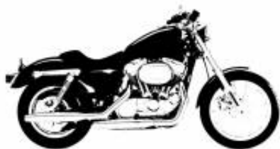
La mia moto + $0.00