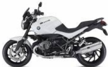
R 1200 R + $699.80