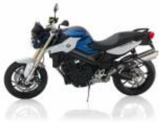
F 800 R + $699.80