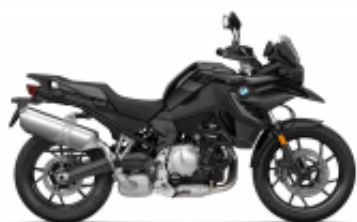
F 750 GS + $3,271.39