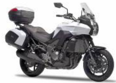
Versys 1000 Grand Tourer + $329.56