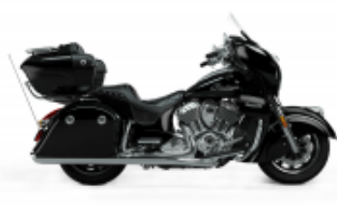
Roadmaster 1890 Grand Touring Class + $664.83