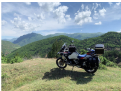
4 - Velingrad - Sofia - 400