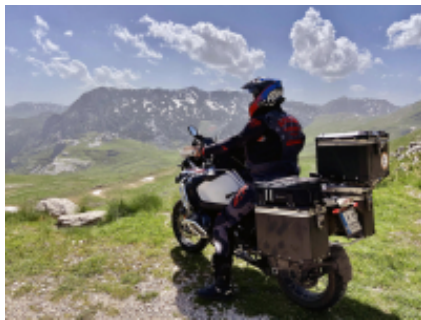
1 - Sofia - Sofia - 0