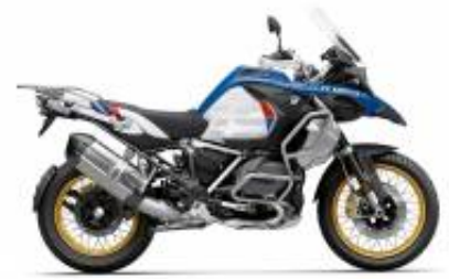
R 1250 GS Adv LC + $176.13