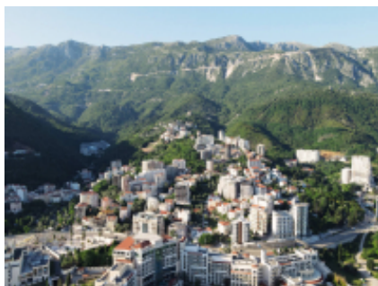
3 - Veliko Tŕrnovo - Velingrad - 340