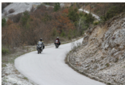
5 - Sofia - Sofia - 0