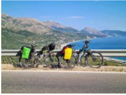
1 - Tirana - Tirana - 0