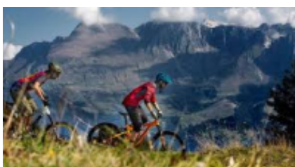
6 - Bënjë - Përmet - 0