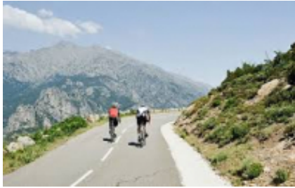
2 - Tirana - Pogradec - 29