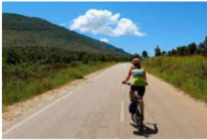
3 - Pogradec - Corizza - 51