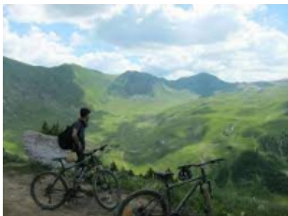
5 - Sotire - Bënjë - 66