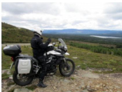
5 - Torla - Calle Azpilicueta - 215