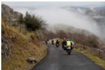
2 - Llançà - Fonda Rigà - 180