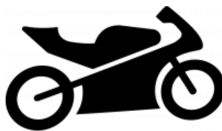
La mia moto + $0.00