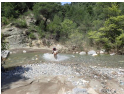
4 - Atene - Atene - 0