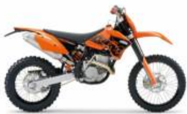
EXC 250 + $0.00