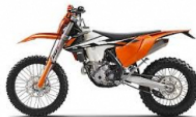
EXC 350 + $0.00