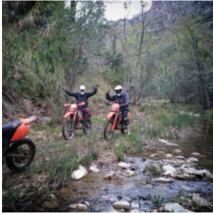
1 - Atene - Atene - 0