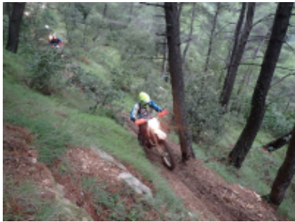
2 - Atene - Atene - 140