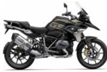
R 1250 GS LC + $280.56