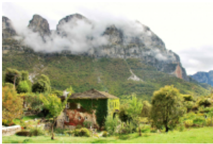
3 - Giannina - Papigo -