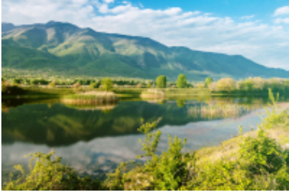
2 - Lake Kerkini - Fort Roupel - 52