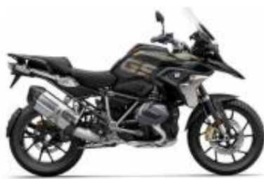
R 1250 GS LC + $187.68