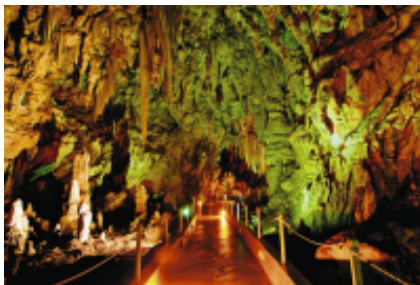
4 - Palaios Panteleimonas, Historical Mountain Village - GS Traveler Moto Rentals - 410