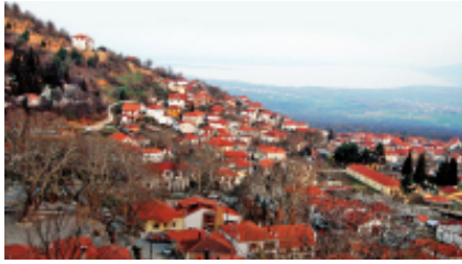
1 - GS Traveler Moto Rentals - Kerkini Lake National Park - 594