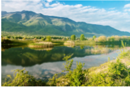
2 - Lake Kerkini - Fort Roupel - 52