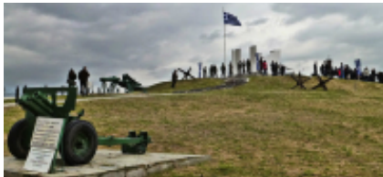
3 - Serres - Alistratis Cave Jeskyne - 63