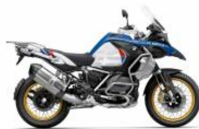
R 1250 GS Adv LC + $278.10