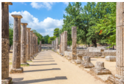
2 - Lagkadia - Stadio di Olimpia - 60