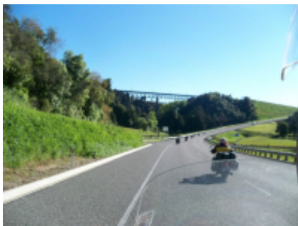
5 - Osoyoos - Vernon - 346 km