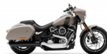
Sport Glide + $850.00