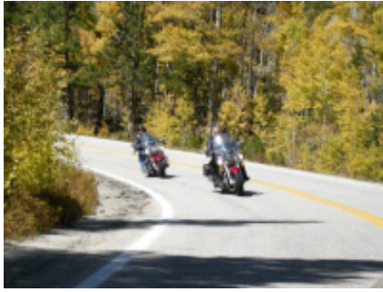
2 - Calgary - Parco nazionale dei laghi Waterton - 430 km