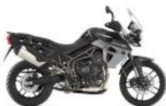
Tiger 800 XRX + $850.00