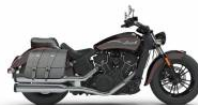
Scout Sixty + $850.00