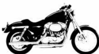
Heritage Softail Cruiser Touring Class + $850.00