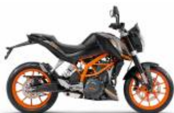
Duke 390 + $0.00