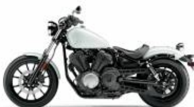
XV 950 Bolt + $850.00