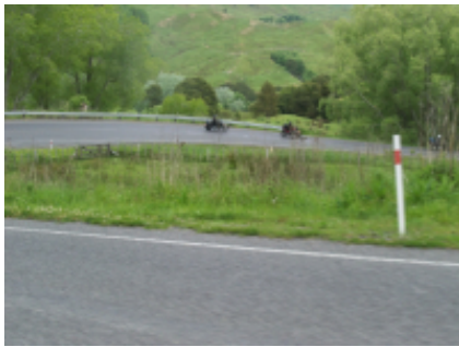
3 - Parco nazionale dei laghi Waterton - Creston - 269 km