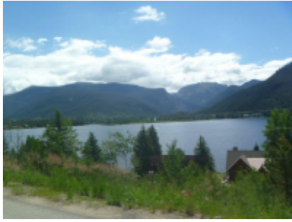
1 - Calgary - Calgary - 25 km