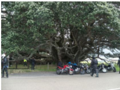
4 - Creston - Osoyoos - 383 km