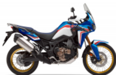
Africa Twin CRF 1000 L + $1,600.00