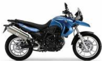
G 650 GS Twin + $850.00