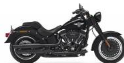
Fat Boy + $850.00