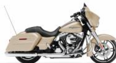
Street Glide Special + $850.00