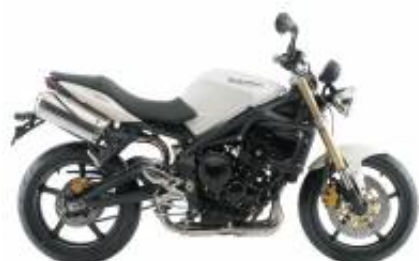
Street Triple 675 + $850.00