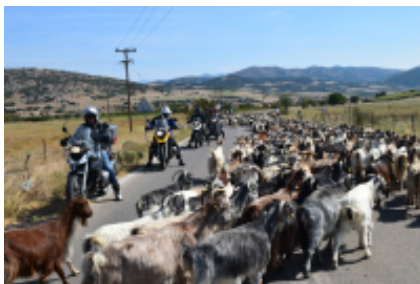
4 - Lamia - Atene - 275