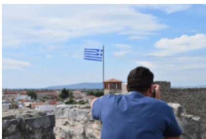
5 - Atene - Atene - 0