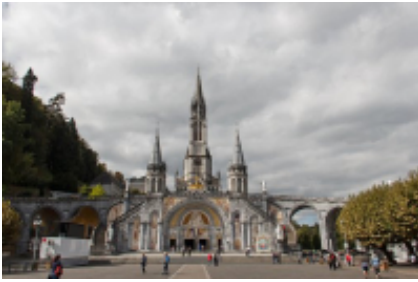
3 - Andorra la Vella - Tarbes -