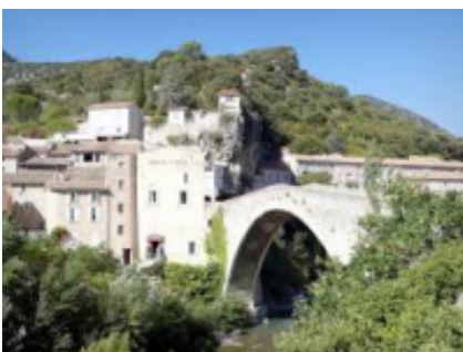
6 - Manosque - Draguignan -