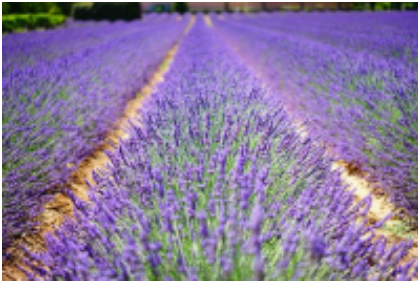
3 - Mouriès - Mouriès -