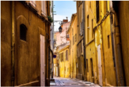
2 - Mouriès - Mouriès -