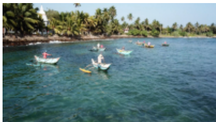
8 - Roccia del leone - - 170