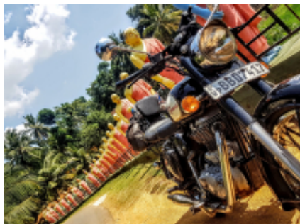
11 - Tissamaharama - Mirissa - 120