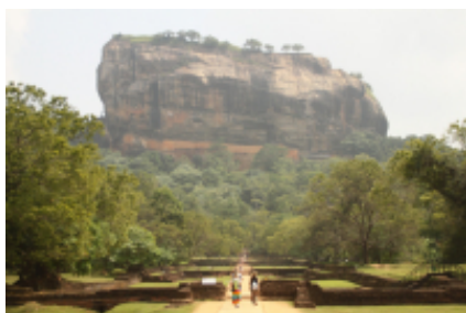
3 - Distretto di Anuradhapura - Jaffna - 225