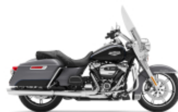
Road King Street Classic Class + $698.45