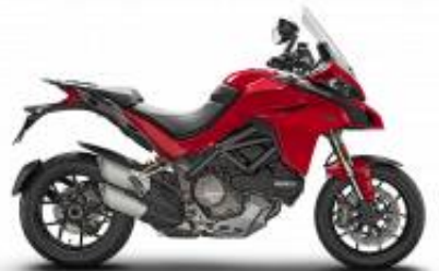
Multistrada 1260 + $582.32