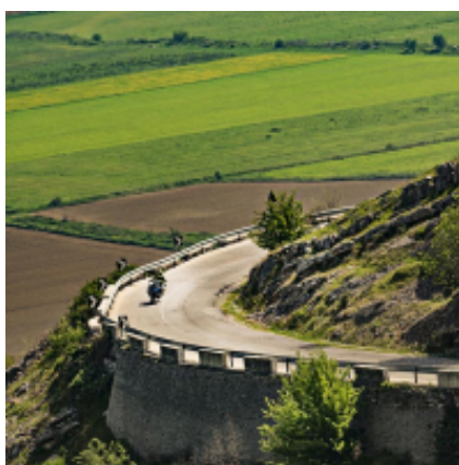
5 - Prizren - Kolašin - 320 km