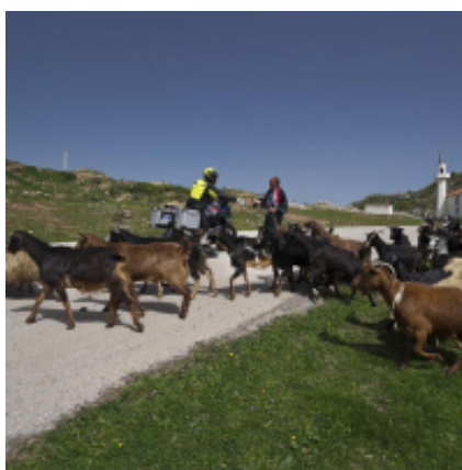
3 - Përmet - Ocrida - 250 km