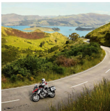
2 - Tirana - Përmet - 250 km