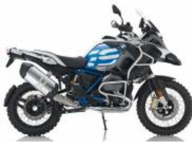
R 1200 GS Adv + $279.69