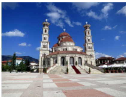
1 - Tirana - Tirana -