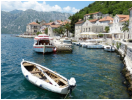
7 - Cattaro - Tirana - 240 km