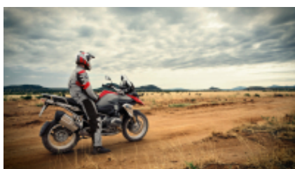
4 - Ocrida - Prizren - 300 km