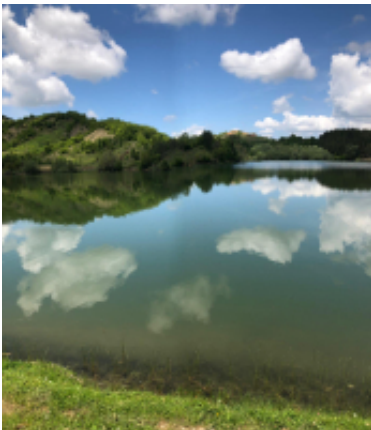
8 - Tirana - Tirana - 0 km