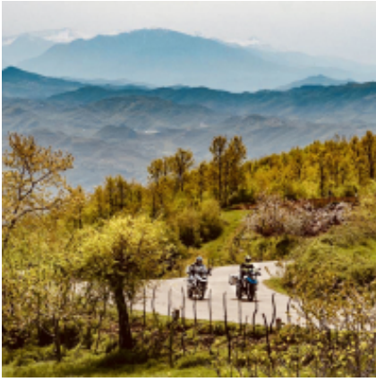
6 - Kolašin - Cattaro - 300 km