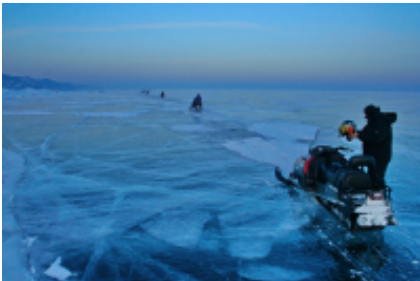
4 - Irkutsk - Irkutsk -