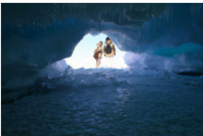
5 - Irkutsk - Irkutsk -