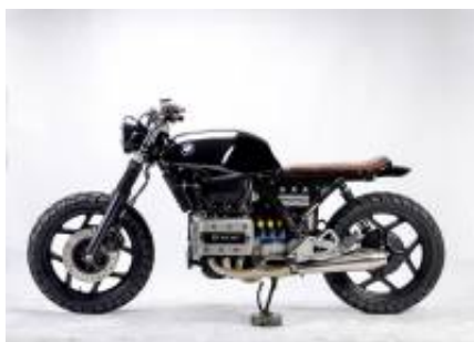
K75 Scrambler + $0.00