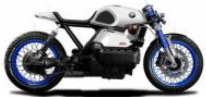
K75 Cafe Racer + $0.00