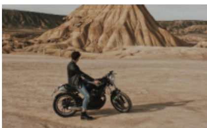
6 - Merzouga - Al-Rashidiyya - 130