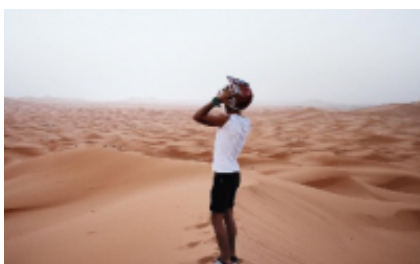
5 - Merzouga - Merzouga - 190