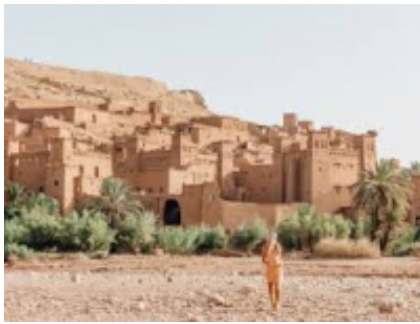
2 - Marrakech - Ait-Ben-Haddou - 180