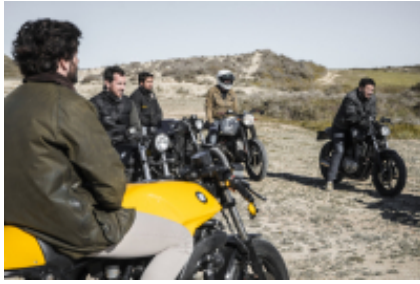
1 - Marrakech - Marrakech - 50