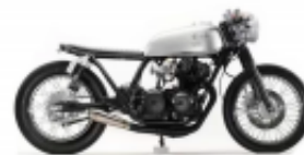
CB 250 Cafe Racer + $0.00