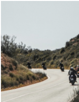
3 - Ait-Ben-Haddou - Dades - 190