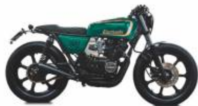
KZ550 Caferacer + $353.19