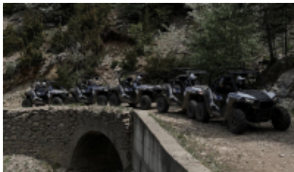
3 - Al-Rashidiyya - Al-Rashidiyya -