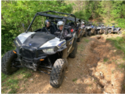
1 - Al-Rashidiyya - Al-Rashidiyya -