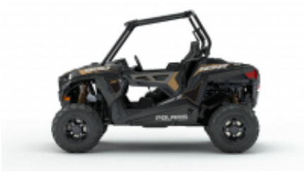
RZR 900 + $0.00