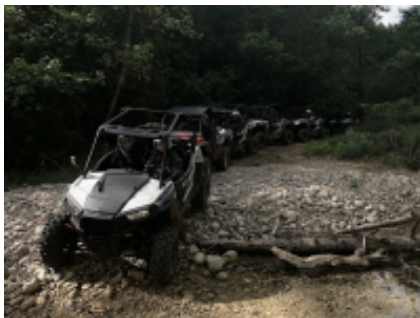
4 - Al-Rashidiyya - Al-Rashidiyya -