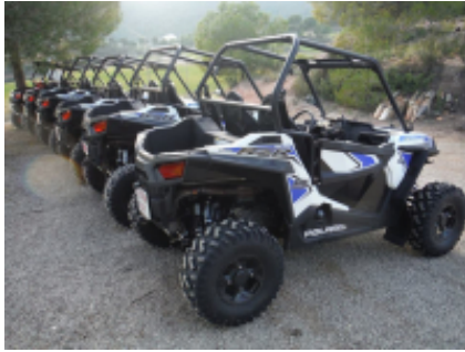
2 - Al-Rashidiyya - Al-Rashidiyya -