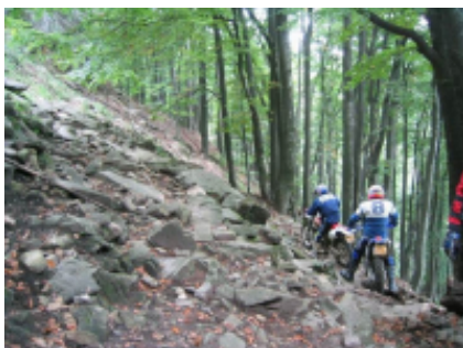
6 - Sibiu - Măgura - 8h