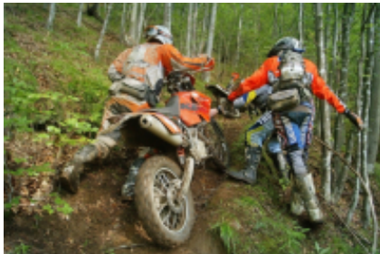
3 - Sibiu - Șugag - 8h