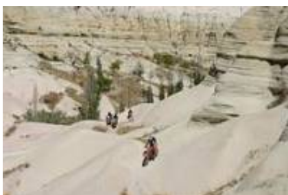
6 - Güzelyurt - Göreme -