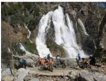
4 - Distretto di Taşkent - Karapınar -