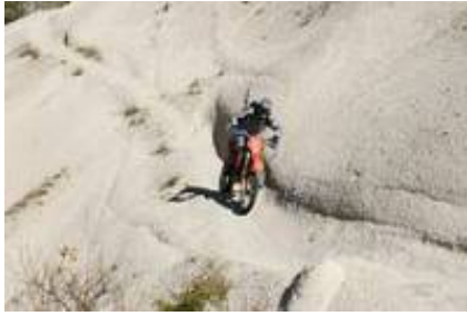
1 - - Adalia -