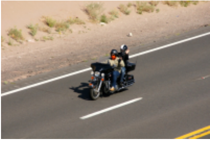
7 - Sturgis - Sturgis - 0 km