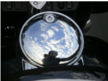
5 - Sturgis - Sturgis - 0 km