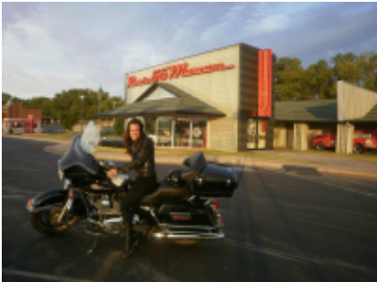
4 - Rapid City - Sturgis - 0 km