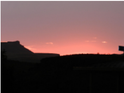
3 - Casper - Rapid City - 404 km