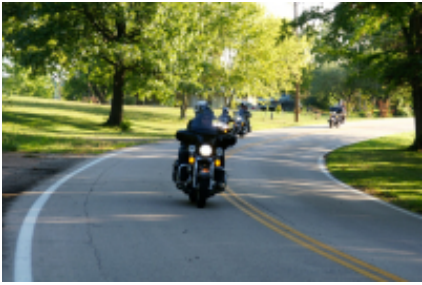
8 - Rapid City - Cheyenne - 436 km