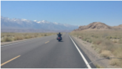
2 - Denver - Casper - 444 km