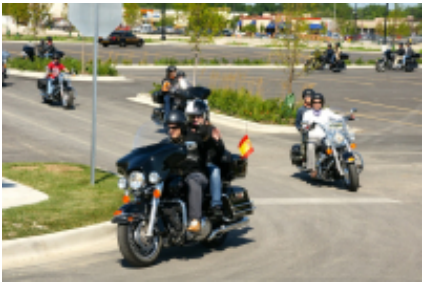
9 - Cheyenne - Denver - 236 km