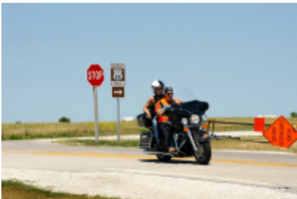
10 - Denver - - 0 km