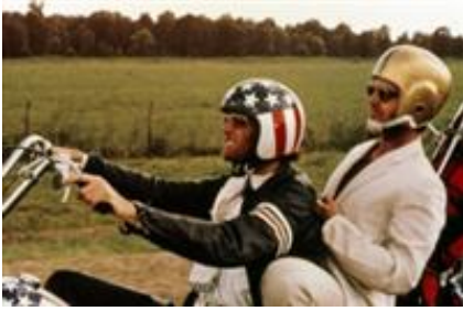
1 - - Denver - 0 km