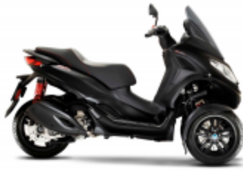
MP3 300 + $0.00