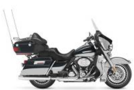
Road Glide Ultra Grand Touring Class + $0.00