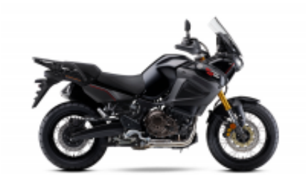
Super Tenere 1200 + $0.00