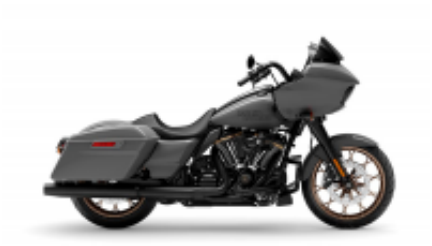
Street Touring Road Glide + $0.00