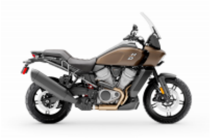
Pan America 1250 + $0.00