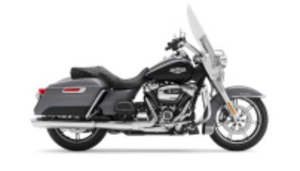
Road King Street Classic Class + $0.00