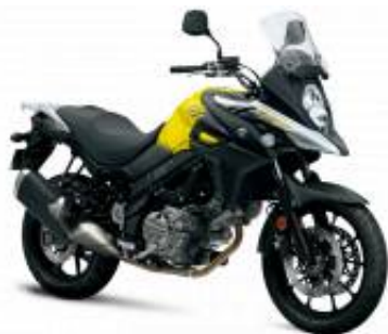
DL 650 V Strom + $0.00