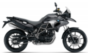
F 700 GS + $196.12