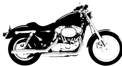
F 800 GS + $288.42