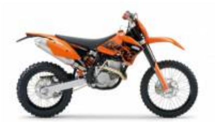
EXC 250 + $0.00