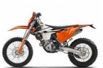
EXC 350 + $0.00