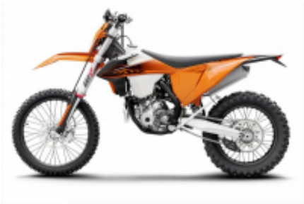
TPI/Six Days 300 + $0.00