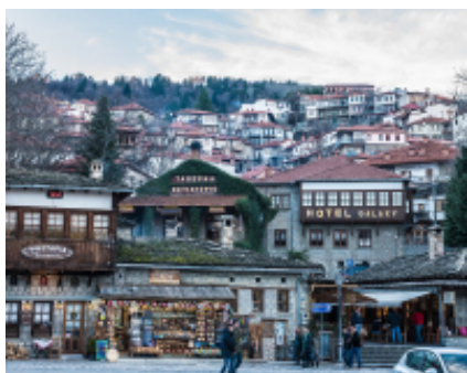
5 - Janina - Metsovo -