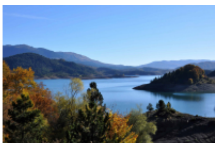
4 - Janina - Pindos National Park -