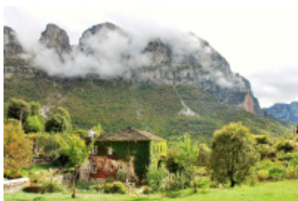
3 - Janina - Papingo -