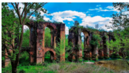
1 - GS Traveler Moto Rentals - Janina -