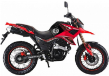
Fuego Tekken 250 + $0.00