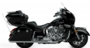
Roadmaster 1890 Grand Touring Class + $901.68