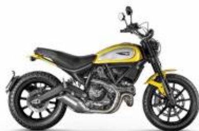
Scrambler Icon 800 + $0.00