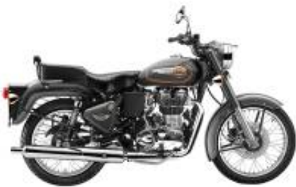
Bullet 500 + $0.00