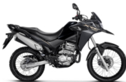
XRE300 + $0.00