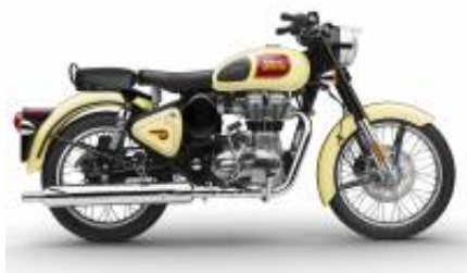
Classic 500 + $0.00